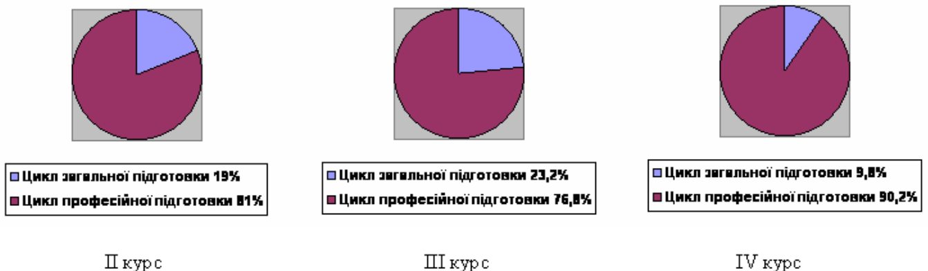
Рис.1. Діаграма розподілу освітніх компонент (ОК) в рамках освітньо-професійної програми підготовки молодшого спеціаліста зі спеціальності 223 «Медсестринство».

В обов'язковій частині передбачено 9 навчальних дисциплін циклу загальної підготовки (ОЗП) ( 20,8 кредити), та 39 дисциплін циклу професійної підготовки (ОПП) ( 93,7 кредитів), виробничу практику ( 2,5 кредити), переддипломну практику ( 9 кредитів).