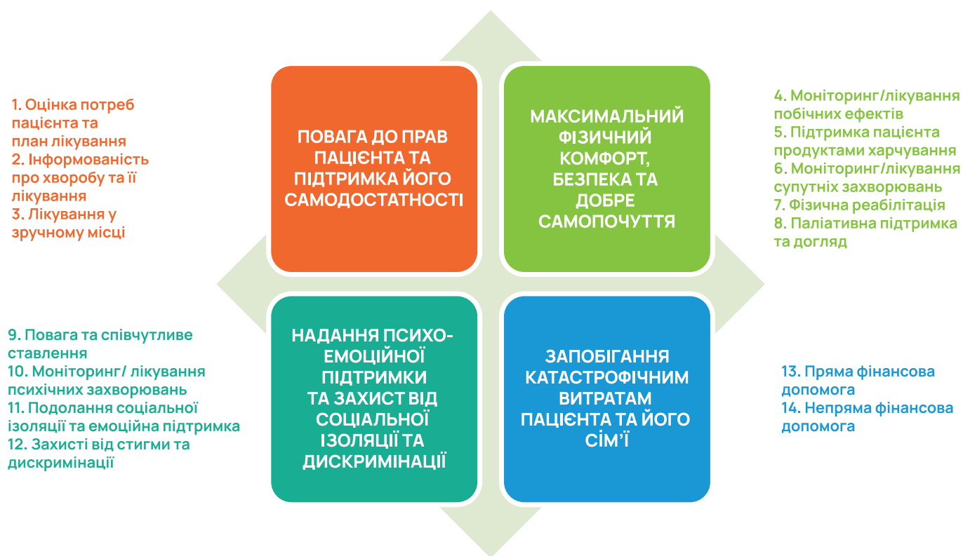
Схема, що ілюструє комплексність роботи пацієнто-орієнтованого підходу